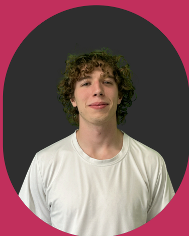
Baptiste Bosle Communication

SOAR est une équipe STEM-Racing de 5 étudiants en première année d'ingénieur à l'ESTACA, qui ont tous un point en commun : la passion pour l'automobile. Nous sommes rattachés à ITD, la plus ancienne association d'automobile de l'ESTACA, un atout majeur pour notre projet compétitif.