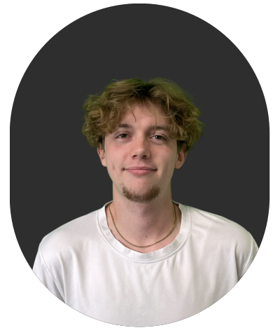
Paul Magnan Partenariats